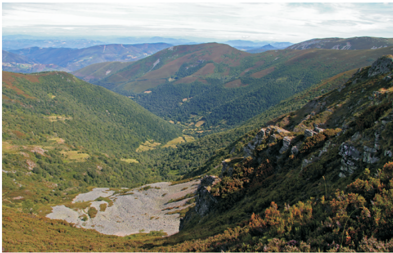
Val do Ortigal no que se aprecian as pegadas glaciares.