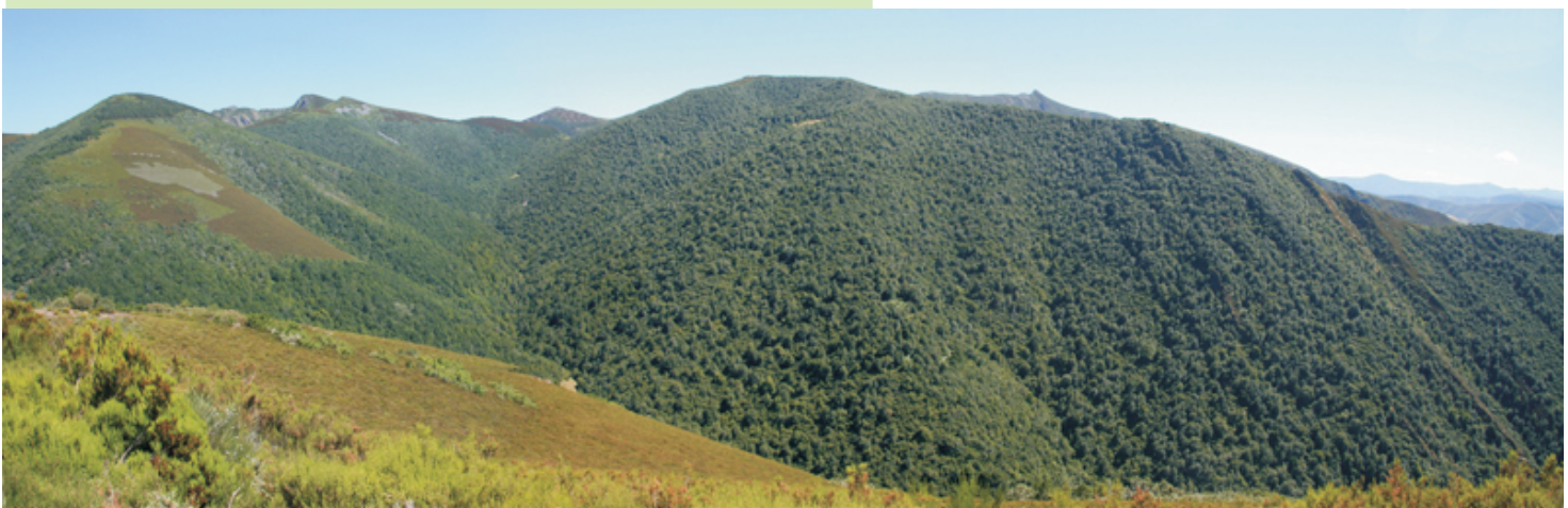
Vista da fraga da Cabana vella cos picos da serra de Ancares ao fondo (entre Tres Bispos e Pena Rubia).