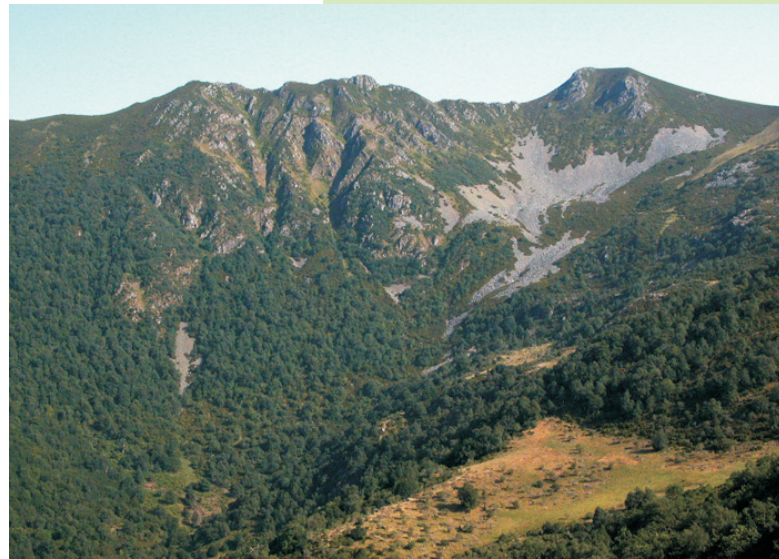
Cumes de Tres Bispos e Os Penedois