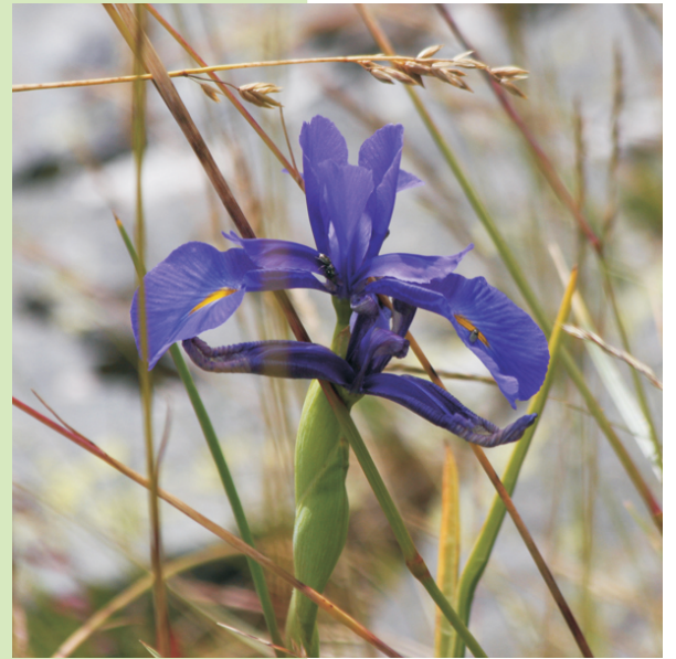
Lirio de montaña ( Iris latifolia )