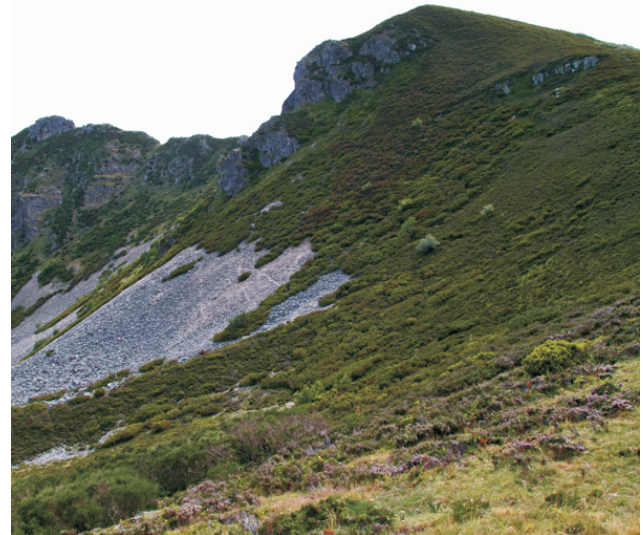
Cume de Tres Bispos