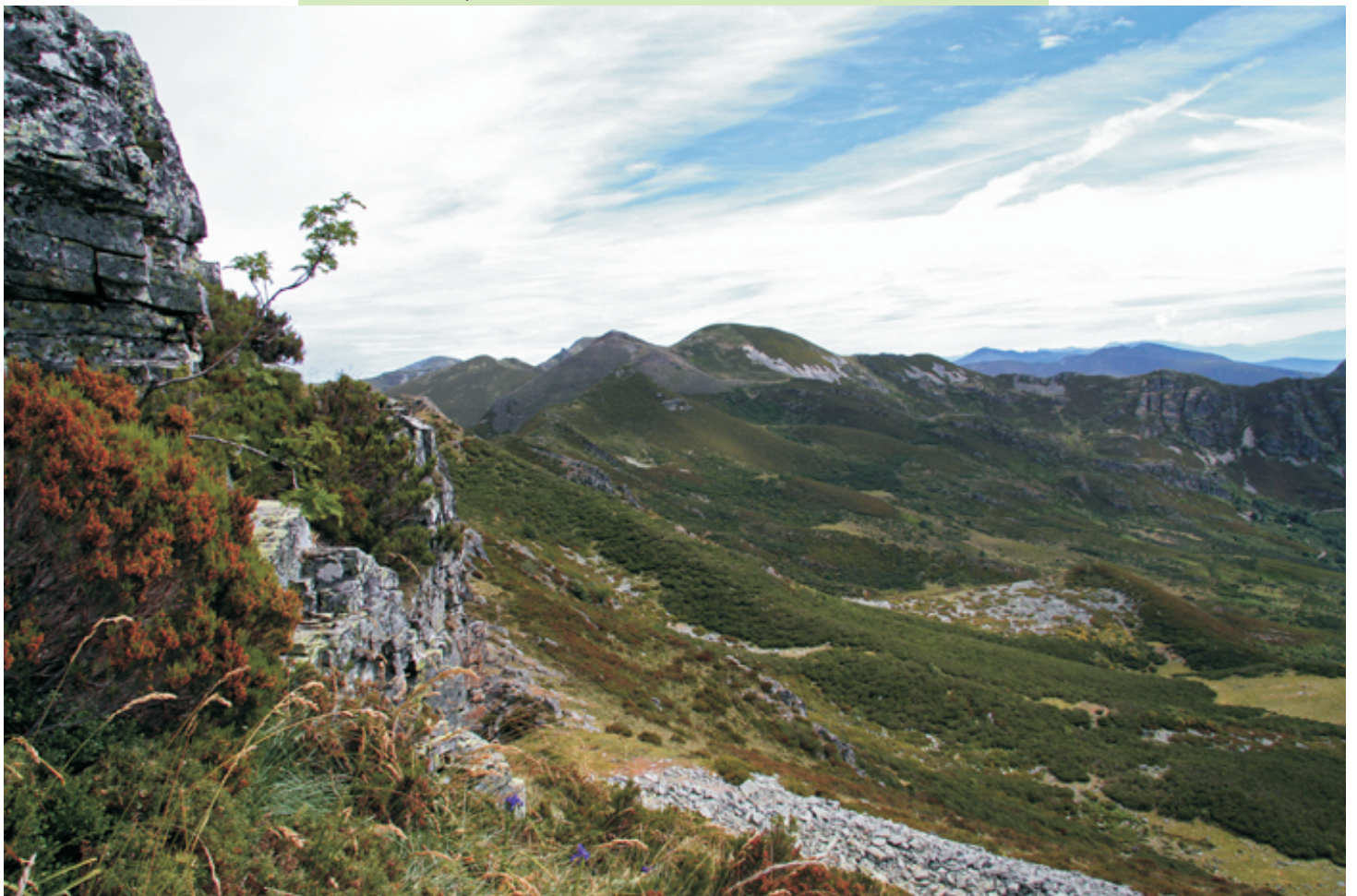
Cumes dos Ancares cara o norte desde Tres Bispos: Lagoas, Corno Maldito...