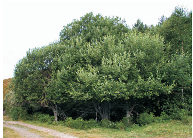
Salix capre, un salgueiro que en Galicia só medra nas serras orientais.