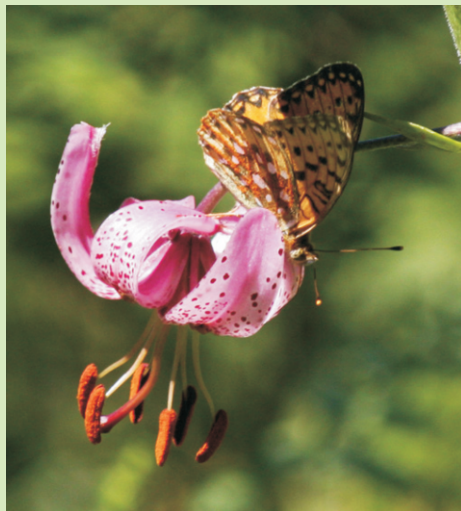
Lilium martagon , atópase nas zonas montañosas

A volta pódese facer polo mesmo camiño ou baixar pola fraga de Cabana Vella, con fortes descensos e unha subida no tramo final.