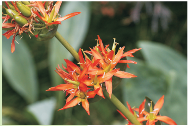
Xensá ( Gentiana lutea )